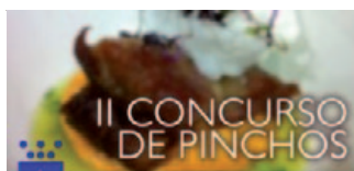
Cartel anunciador del concurso de pinchos

Se trata de una iniciativa que pretende impulsar la hostelería de Arroyo de la Encomienda animando a los hosteleros a realizar pinchos para tapeo a buen precio y de esta manera conseguir crear una cultura de tapas en la localidad atrayendo nueva clientela de dentro y de fuera de Arroyo.